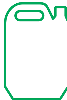
5000 ml kanister