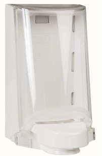
Art. nr 4546 Automaatne dosaator