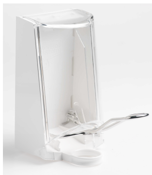
Art. nr 4567