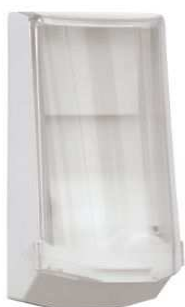
Art. nr 4551