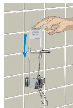
Art. nr 9501 DP hoidja Art. nr 9500 DP dosaator

Turul on DispensoPac'i erinevaid variante. Sterisol kott sobib tänu oma väikesele hoidjale, mis kinnitatakse olemasoleva variandi peale, kõikide variantidega. Seda tehakse esmakordsel kokkupanemisel ning hoidja jääb alatiseks dosaatori peale.